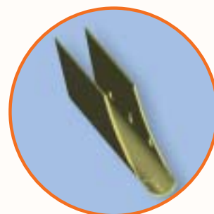
Hölje för kondensatrör